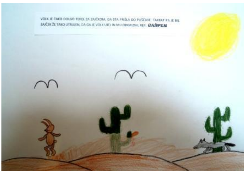
Slika 11: Od kdaj ima zajček kratek rep?

Zajček je volku zbežal. Nekega dne pa si je zaželel, da bi imel krajši rep, zato mu ga je njegov prijatelj zajček odstrigel. (Nika)