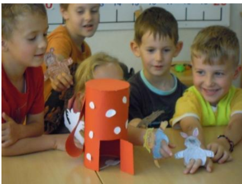
Slike 16, 17, 18: Uprizoritev igre Mojca Pokrajculja