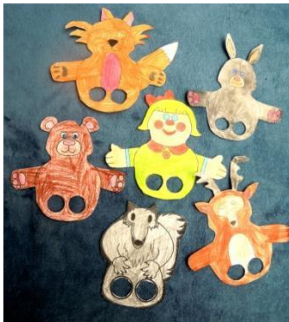
Slika 15: Prstne lutke za igro Mojca Pokrajculja