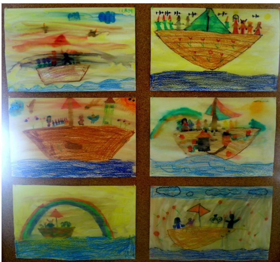
Slika 27: Barčice s pravljичnimi junaki

Meseca junija je bil čas, ko smo se v našem pravljичnem svetu odpravili na morje ... Učencem sem zapela pesem Barčica po morju plava . Mnogi učenci so pesem že poznali in so začeli prepevati z menoj. Ker pesem ne pove, kdo pluje na tej posebni pravljичni barčici, je to postala uganka, ki smo jo morali razrešiti. Ugotovili smo, da je to pravljična barčica in učenci so začeli naštevati različne pravljične in druge domišljijske junake, ki bi lahko pluli na njej. Pesem smo se naučili zapeti, nato pa so učenci barčice tudi narisali. Risali so s flomastri in z voščenkami, nato pa ozadje prebarvali s tempera barvo, kar je njihovim risbam dalo domišljijsko-umetniški vtis.