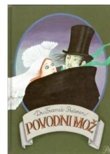
Slika 22: Slikanica Povodni mož

Zanimivost stripov pri upodobitvah povodnega moža je bila ta, da je veliko učencev (predvsem deklic) povodnega moža narisalo kot moškega oblečenega v črno ogrinjalo, na glavi pa je imel črn cilinder. Menim, da so učenci že poznali Prešernovo slikanico Povodni mož , katero so najverjetneje brali pri pouku na Prešernov dan.