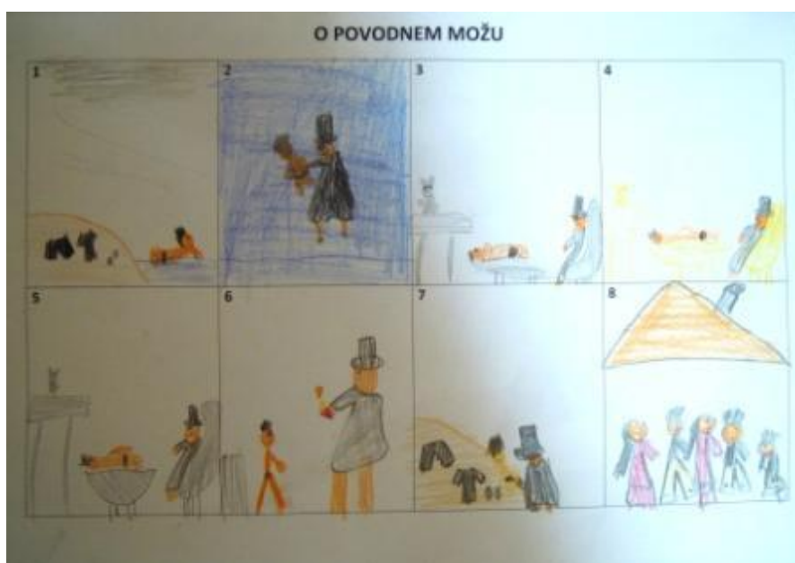
Slika 21: O povodnem možu – »slikovni strip«

Zanimivost stripov pri upodobitvah povodnega moža je bila ta, da je veliko učencev (predvsem deklic) povodnega moža narisalo kot moškega oblečenega v črno ogrinjalo, na glavi pa je imel črn cilinder. Menim, da so učenci že poznali Prešernovo slikanico Povodni mož , katero so najverjetneje brali pri pouku na Prešernov dan.