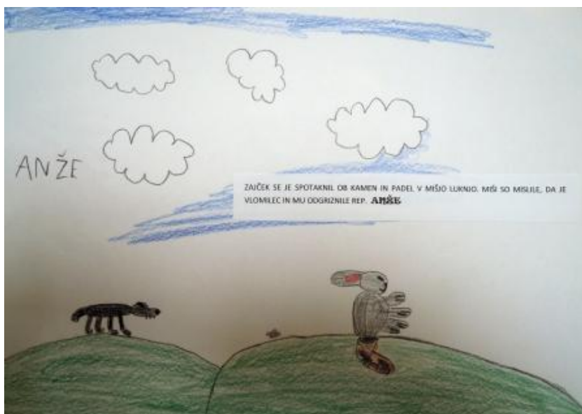
Slika 7: Od kdaj ima zajček kratek rep?

Zajček se je spotaknil ob kamen in padel v mišjo luknjo. Miši so mislile, da je vlomilec, in so mu odgriznile rep.