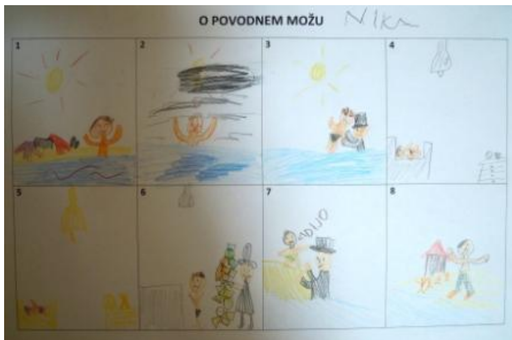
Slika 19: O povodnem možu – »slikovni strip«

Izdelali smo enostaven strip. Ker vsi učenci še niso znali pisati, so stripe le narisali, nato pa so jih ustno predstavili.