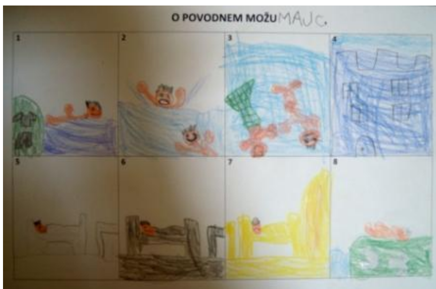
Slika 20: O povodnem možu – »slikovni strip«