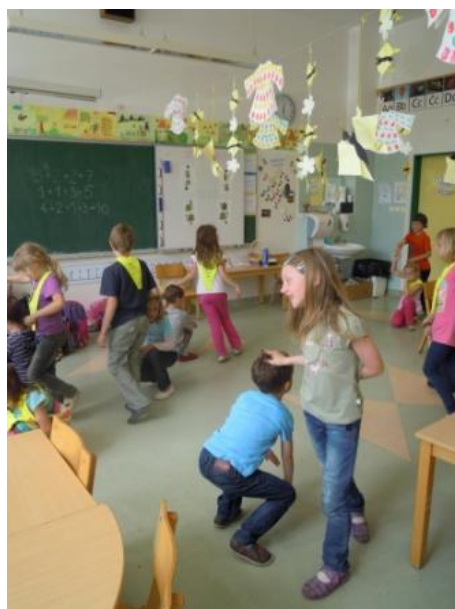
Slike 23, 24, 25: Ples Ob bistrem potočku je mlin