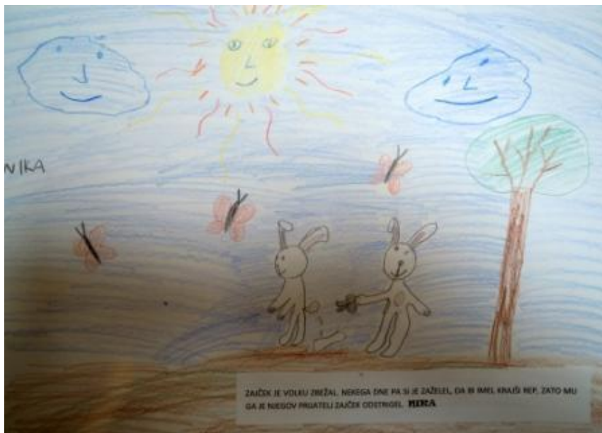
Slika 10: Od kdaj ima zajček kratek rep?

Zajček je volku zbežal. Nekega dne pa si je zaželel, da bi imel krajši rep, zato mu ga je njegov prijatelj zajček odstrigel. (Nika)