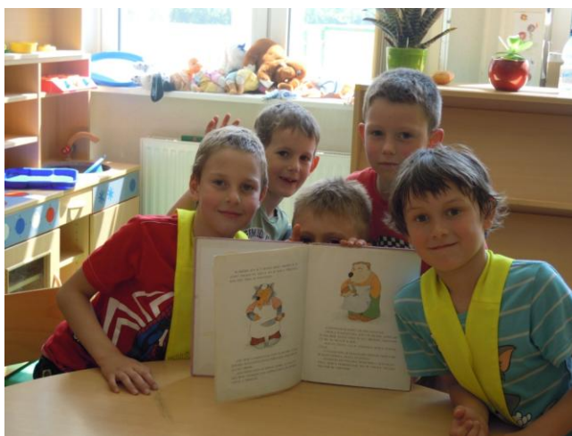
Slike 4, 5, 6: Primerjava slikanic