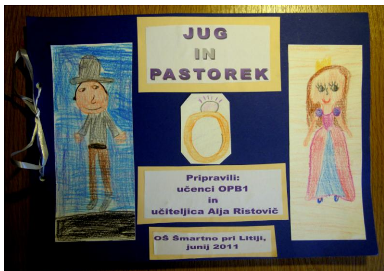
Slika 26: Slikanica Jug in pastorek

Nato smo se lotili projekta izdelave slikanice. Z učenci smo se najprej dogovorili, kateri dogodki v pravljici so pomembni, nato pa so v parih izdelali ilustracije in mi ob njih pripovedovali, kaj se je zgodilo. Vse sem zapisala in besedila prilepila ob njihove ilustracije. Nekateri pari so narisali tudi po dve ilustraciji, zato ima naša slikanica kar 17 strani. Na koncu smo se skupaj dogovorili še o izgledu naslovnice, jo skrbno izdelali in slikanico razstavili v razrednem knjižnem kotičku. Skupaj smo jo tudi prebrali in si ogledali ilustracije.