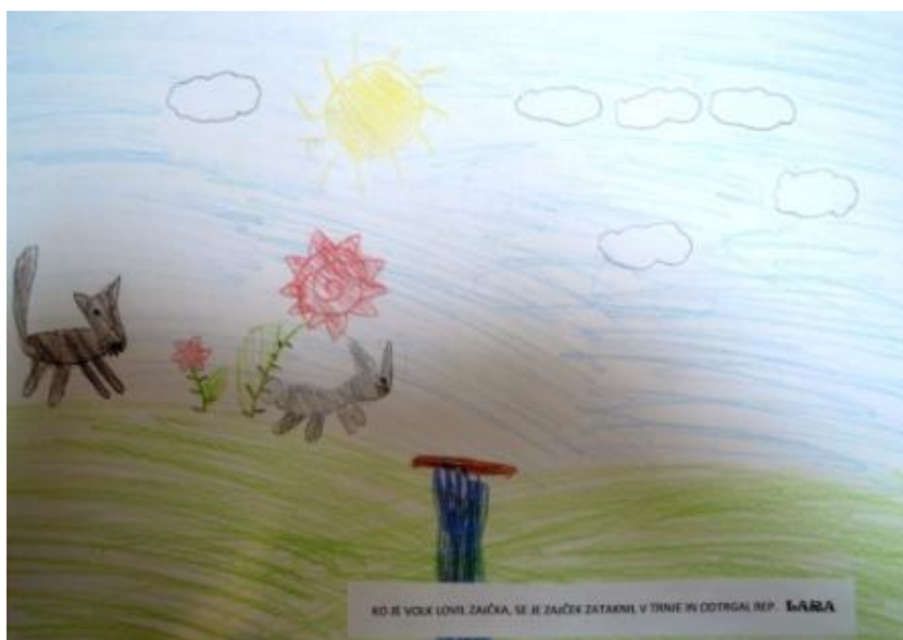
Slika 9: Od kdaj ima zajček kratek rep?

Ko je volk lovil zajčka, se je zajček zataknil v trnje in si odtrgal rep.