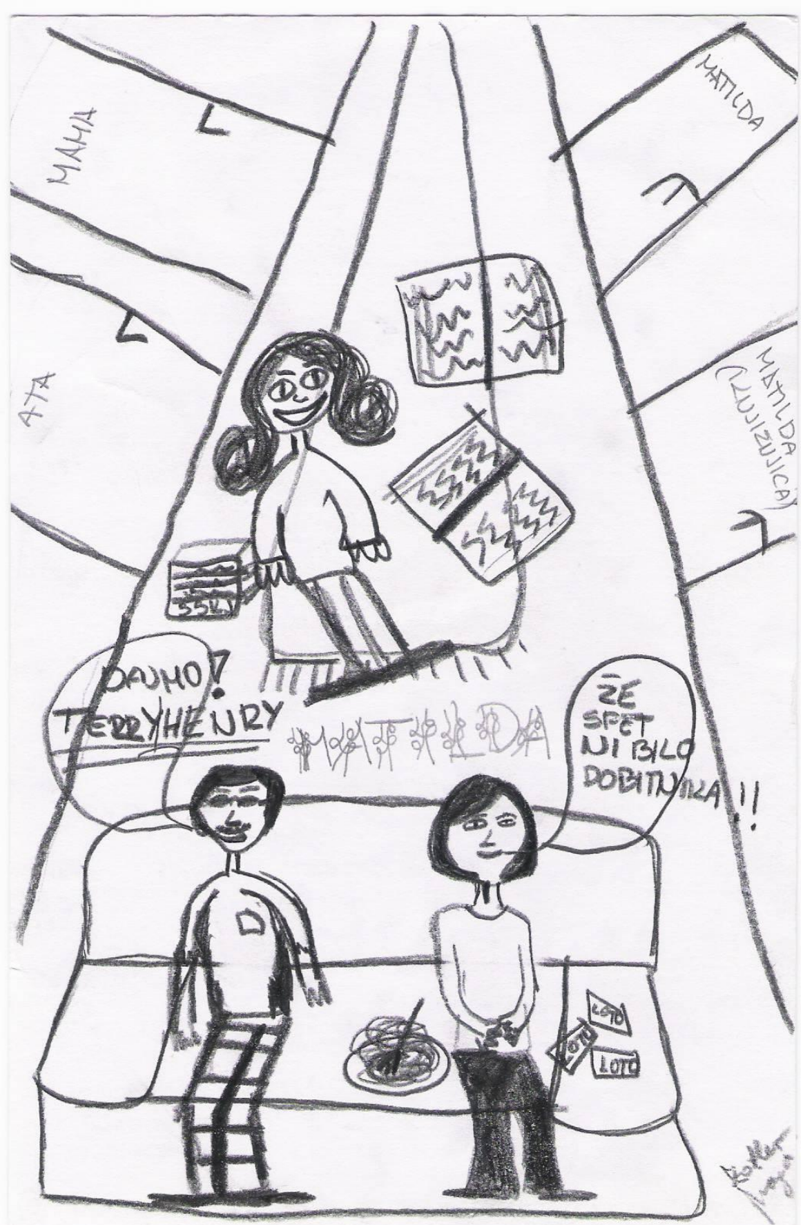
Mojca Zotler: Matilda