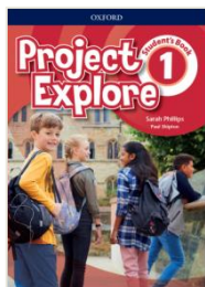
Učbenik s 100% novo vsebino

Project Explore je serija, na katero se lahko zanesete, saj temelji na učinkoviti in preverjeni metodi serije Project . Znana, funkcionalna, pregledna in učinkovita zgradba učne enote, popolna usklajenost učbenika in delovnega zvezka ter ostalih podpornih komponent, medkulturno ter medpredmetno povezovanje v vsaki učni enoti in vso gradivo za učitelja na enem mestu v priročniku - to so temeljni aduti, ki jih velja preučiti, ko izbirate NOV učbeniški komplet za 6 – 9. razred .