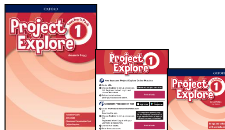
Priročnik za učitelja z digitalnim gradivom, e-redovalnico, podpornimi gradivi in DVD-ROMom

Slovenska izdaja je v tisku, zato je trenutno na voljo mednarodna izdaja za potrebe OGLEDov, slovenska izdaja prihaja že junija! Za informacije o spremembah v slovenski izdaji vas prosimo, da se obrnete na spodnje kontakte.